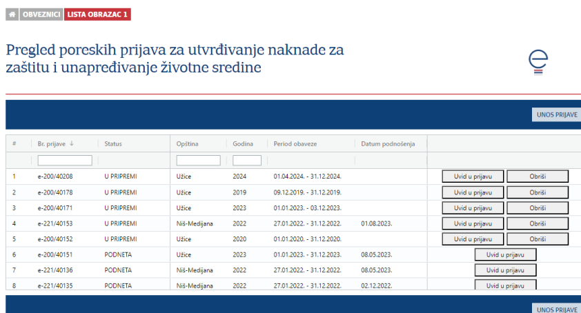
Slika br. 3: Pregled prijava

Po izboru ovlašćenja, korisniku se prikazuje lista već kreiranih i podnetih prijava (slika br. 3). Uvid u podatke već evidentiranih prijava moguć je preko akcije „Uvid u prijavu“.